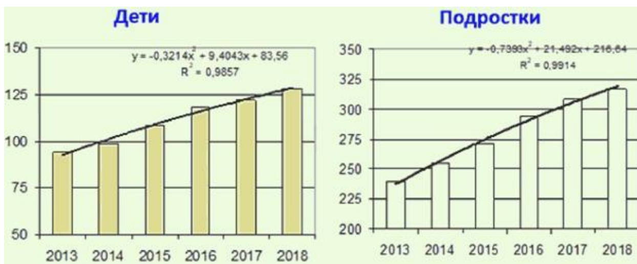
Рисунок 1 - Распространенность сахарного диабета у детей и подростков (на 100 тыс.)

Статистика заболеваемости детей и подростков сахарным диабетом в целом по Российской Федерации свидетельствует о стабильном росте распространенности данной патологии; уровень заболеваемости сахарным диабетом у подростков стабильно более чем в 2 раза превышает таковой у детей (рис. 1) [4 - 15].